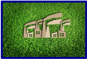
Décarbonation industrie 5,350 Mds