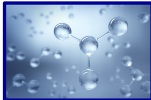
Hydrogène décarboné 460 M (sans IPCEI)