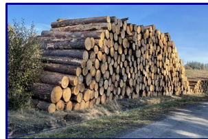
Bois Forêt 320 M