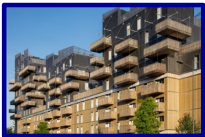
Ville Durable Bâtiment innovant 320 M