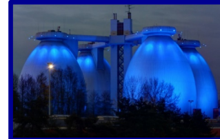
Produits biosourcés Carburants durables 450 M