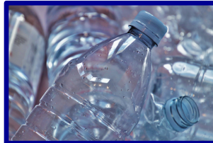
Recyclage 470 M