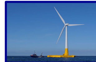
Energies renouvelables 1 Mds