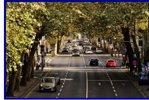
Décarbonation Mobilités 600 M